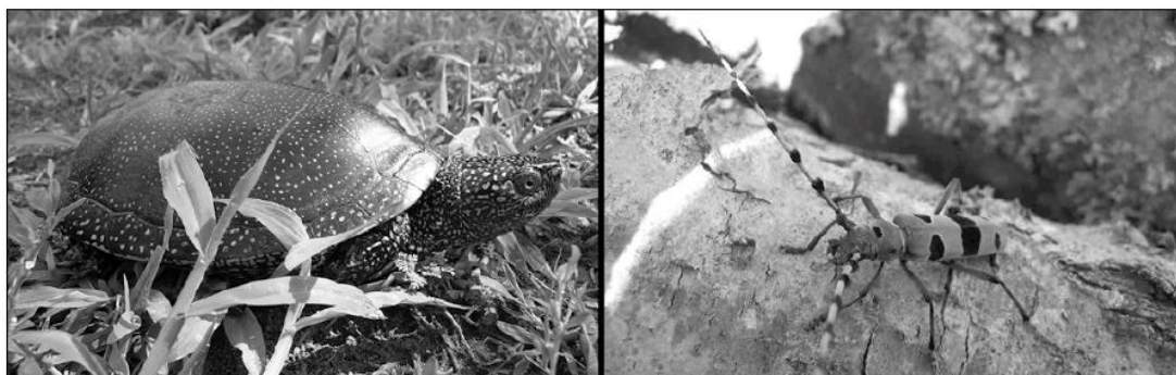
Deux espèces discrètes, mais facilement reconnaissables : la Cistude d'Europe et la Rosalie des Alpes.

L e site Natura 2000 de la vallée du Moron et le Syndicat du Moron participent depuis l'année passée à un effort de prospection, visant la recherche d'espèces protégées. L'année dernière, nous recherchions déjà le coléoptère Rosalie des Alpes. Cette année, en partenariat avec le site Natura 2000 des Landes de Montendre et la vallée de la Seugne, l'enquête est en cours depuis le mois de juin, et vise la tortue Cistude d'Europe... Les observations se font rares et nous avons besoin de vous !