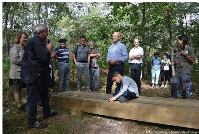
Découverte du banc de contemplation du belvédère lors de l'inauguration du 6 juillet 2016