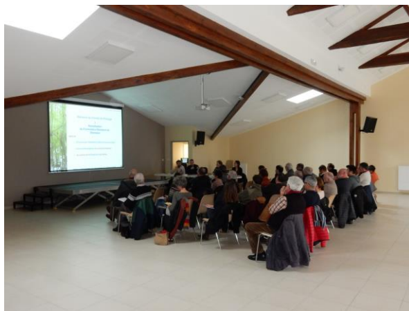
Présentation en salle des actions 2017 et de celles projetées

Le film « L'or des sables » (film sur le Ciron coproduit par le Syndicat Mixte d'Aménagement du Bassin Versant, Château Guiraud, Eclectic Production et Dexip) est diffusé avant de clore la partie salle de l'après-midi.