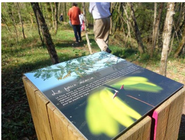
Exemple de panneaux d'information jalonnant le site

Il invite à la découverte sensible du lieu par un mobilier adapté invitant à la contemplation.