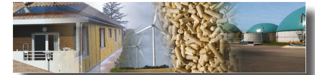
SCoT et SRCAE Mettre de l'énergie dans les SCoT